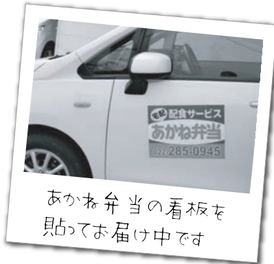
あかね弁当の看板を貼ってお届け中です