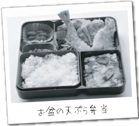
お盆の天ぷら弁当